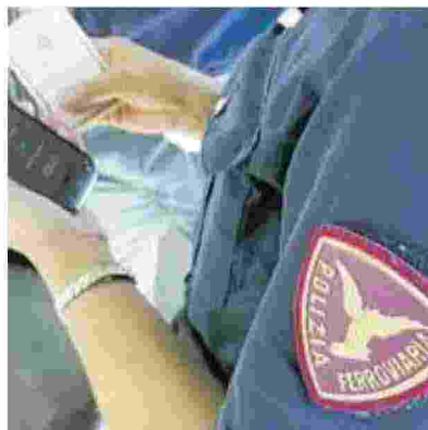
▲ La Polizia Ferroviaria

L'autista è stato medicato al pronto soccorso del Villa Scassi e per fortuna non ha riportato ferite gravi. Secondo quanto denunciato dal sindacato Faisa Cisal , sarebbe stato picchiato da un uomo che pochi istanti prima aveva colpito le porte del mezzo sostenendo che l'autista avesse lasciato a terra qualcuno, quando in realtà non ci sarebbe stato nessuno che doveva ancora salire. Secondo quanto ricostruito dalla polizia, l'arrivo degli agenti ha comunque evitato il peggio. È, in ogni caso, l'ennesimo episodio di violenza che si consuma a bordo dei mezzi pubblici genovesi