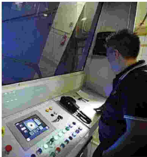
Linea 1 Macchinista in cabina di guida della metro

De Magistris Voglio qualità nei servizi Altrimenti pronto a sciogliere l'azienda di mobilità