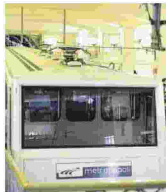
▲ Vagone Un treno della funicolare

Faisa Cisa e Usb "Non permetteremo che la responsabilità cada sui lavoratori viste le condizioni dei mezzi e delle infrastrutture"