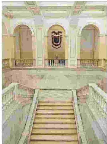
Palazzo dei leoni L'ingresso alla sede della Città Metropolitana