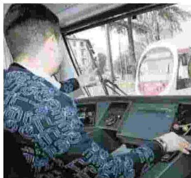
La protesta Sindacati in allarme