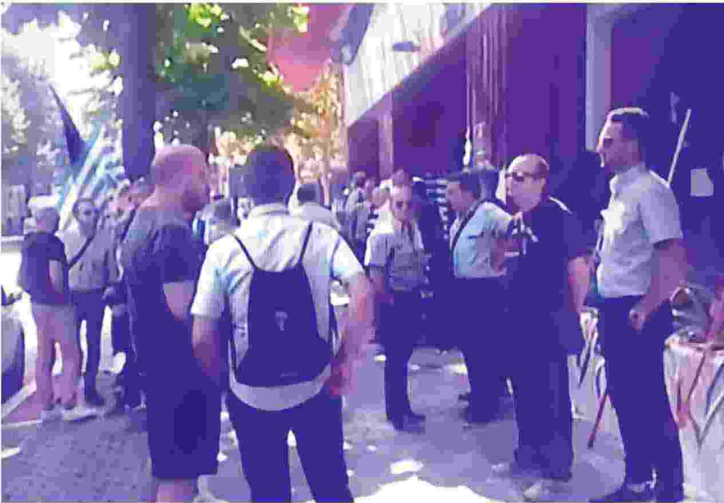
Il sit in dei sindacati dei trasporti davanti alla sede della Regione