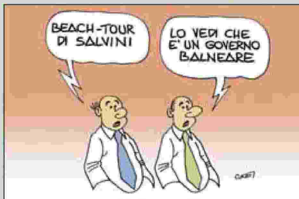
Vignetta di Claudio Cadei

stampa: «Se ci sono indagini, aspettiamole. Che lascino fuori i bambini e se la prendano con me».