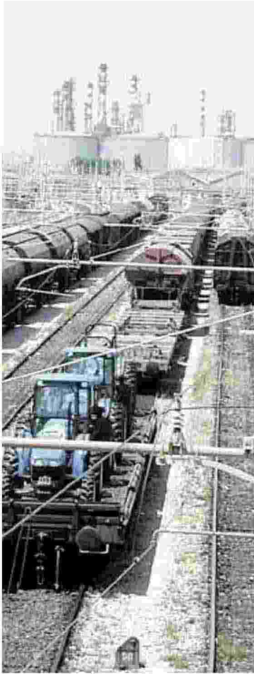
Un treno merci