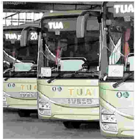
E' scontro sul trasporto pubblico

► Opposizioni e sindacati all'attacco ► Paolucci: «Per la Giulianova-Roma si penalizzano le aree interne e fragili»