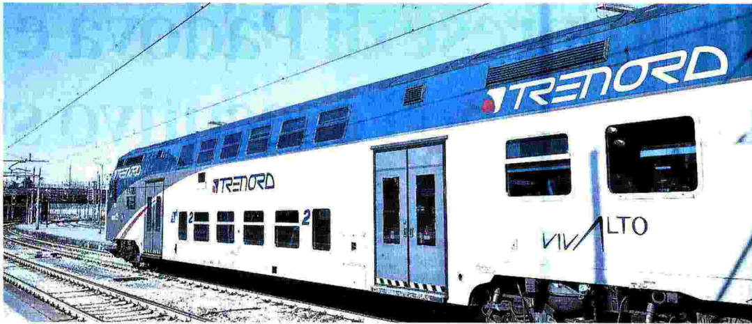
Trenord. Nuovo investimento sul personale da 10 milioni di euro