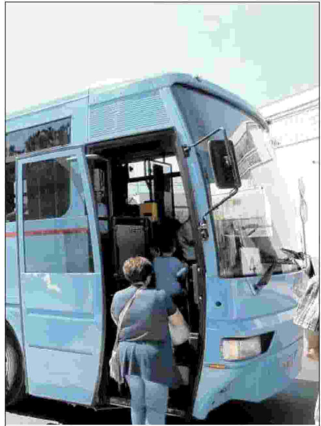
A sinistra Egidio Albanese. Qui sopra un bus del Consorzio Trasporti pubblici