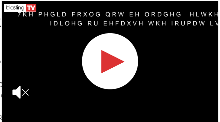
6 F L R S H U R W U H Q L H D X W R E X V G D Q

, O S U M F L R S H U R G H L P H J J V D S U E L Q Y F L G u Q H O O D 5 R L P D V $ G G I L Q F U R F L D U H O H E U D S H U V R Q D O H G $ M O D F K R F E H W $ S H U H U j S H U K D Q Q R S U R F O D P D W R L V L Q G D F D W L 2 U V D P H Q W U H O H D V V R F L D J L R Q L , G L & F L D W E J R D J L Q G H W W R O 1 D V W H Q V L R Q H G D O O D Y R U R G H O O 1 D 1 2 H Q G F S U H L O J L X J Q R S H U R