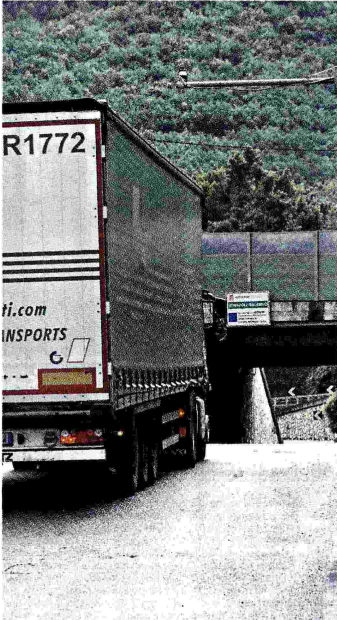
Un tir all'uscita del casello di Nocera Inferiore prima del piano antismog