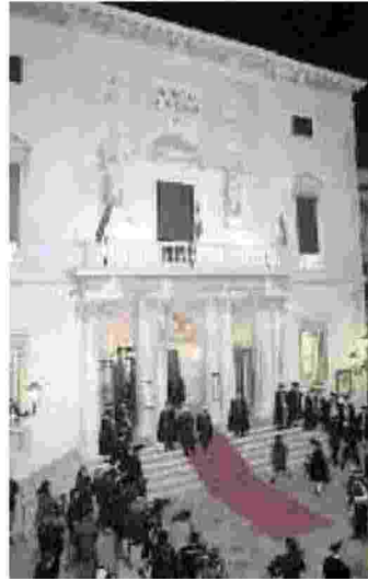
IL TEATRO L'esterno della Fenice