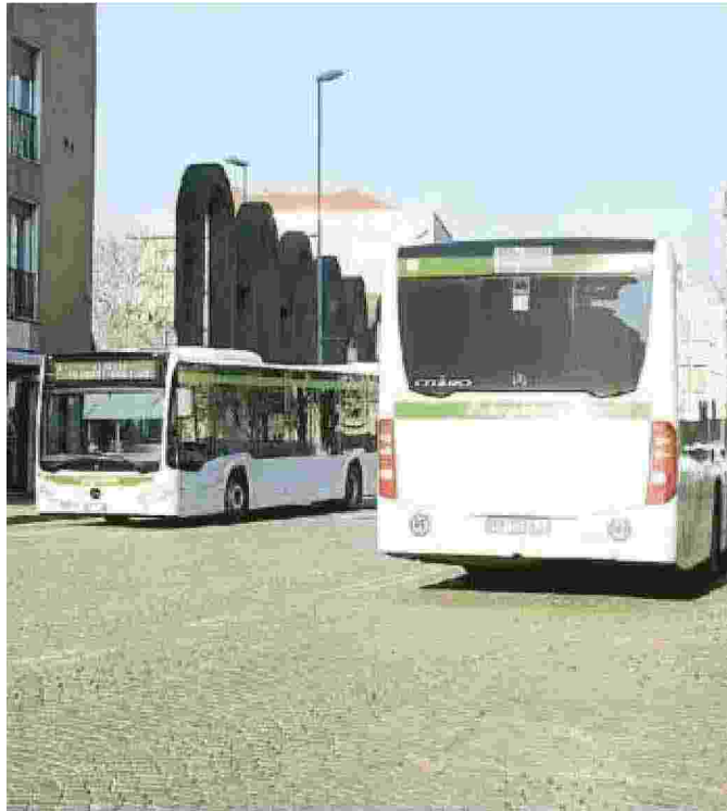
Bus di Autoguidovie in piazza Emanuele Filiberto: oggi lo sciopero

Perché è a Pavia che è partita la grande battaglia dei lavoratori della società milanese a cui, dallo scorso aprile, era stato affidato un appalto che riguarda l'intero territorio provinciale, dal valore complessivo di 119milioni e 660mila euro e della durata di sette anni, 17milioni e 256mila euro circa all'anno.