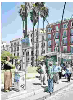
Attesa Utenti dell'Anm in attesa alla fermata in piazza Vittoria

© RIPRODUZIONE RISERVATA © RIPRODUZIONE RISERVATA