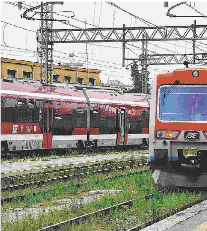
FSE Domani quattro ore di sciopero dalle 8.30 alle 12.30

«L'assemblea non si è potuta svolgere presso nessun locale aziendale perché non idoneo allo svolgimento della stessa - stigmatizzando i rappresentanti - per queste ragioni le segreterie territoriali hanno deciso di svolgere l'assemblea all'aperto, per non disattendere le aspettative dei lavoratori. Stigmatizziamo il comportamento aziendale ritenendolo antisindacale e offensivo nei confronti della dignità dei lavoratori». [m.c.]