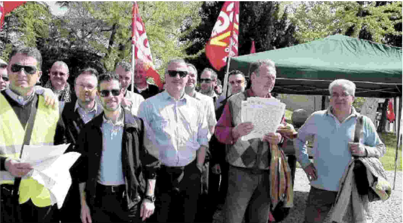
LA PROTESTA Gli autisti del sindacato Sgb Autoferrotranvieri hanno incrociato le braccia e organizzato un picchetto in stazione