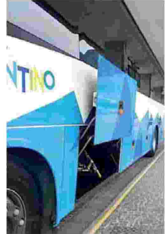
Critiche sul bagagliaio piccolo

traurbani non ha previsto di serie l'installazione delle telecamere interne e ora ci troviamo con un ulteriore grattacapo per il carico delle biciclette e bagagli a causa del ridotto spazio disponibile sui nuovi autobus. Auguriamoci che vada tutto bene e, per ultimo, non crediamo che il "cadenzamento" ogni 15 minuti sulla linea Fiemme/Fassa e l'utilizzo dell'autostrada nel periodo estivo porterà ad un risparmio di 13 minuti sulle percorrenze. Crediamo che un ulteriore anno di verifica e sperimentazione come era stato organizzato nell'estate 2017 avrebbe potuto accertare la buona qualità di quel servizio».