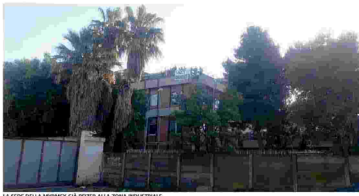
LA SEDE DELLA MYRMEX GIÀ PFIZER ALLA ZONA INDUSTRIALE