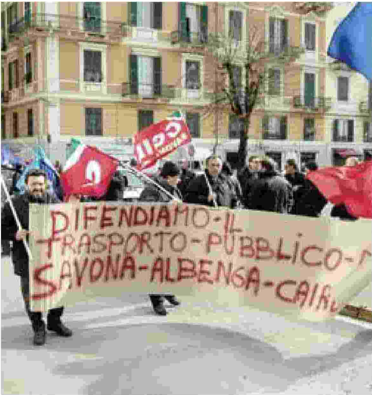
Il corteo dei lavoratori Tpl dello scorso febbraio