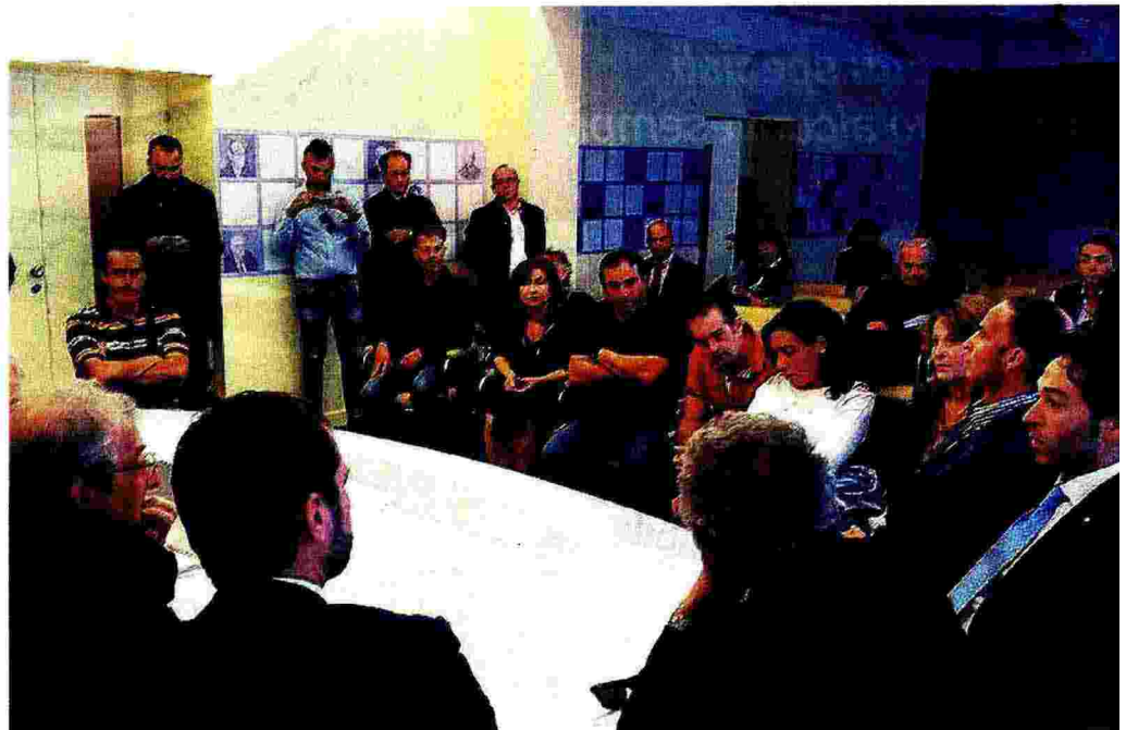
L'incontro. La delegazione dei tirocinanti della Giustizia fa presente le proprie ragioni nella sala Giunta di Palazzo di Vetro