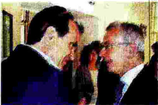
Da mesi il presidente della Provincia Enzo Bruno incalza il sottosegretario Cosimo Maria Ferri

prossimo bando di concorso del 21 novembre 2016 di mille unità anche la possibilità di partecipare ai tirocinanti calabresi esclusi dall'Ufficio del processo». Inoltre, al vaglio anche un possibile progetto di reintegro dei 670 calabresi esclusi dall'Ufficio del processo ministeriale attraverso un nuovo progetto tra Ministero e Conferenza Stato-Regioni: c'è da considerare che il progetto avviato dalla Regione Calabria con fondi propri ancora non è partito e i lavoratori sono senza nessuna forma di sostegno al reddito. «Con questa scelta si eliminerebbe di fatto - spiega ancora la Provincia - la discriminazione attuata con il bando di novembre 2015 quando sono stati avviati solo 1.500 dei 2.600 che avevano cominciato il percorso ministeriale dal 2010». «