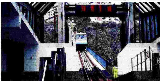
Piazza Roma-Sala. La funicolare, ottenuta il via libera definitivo dell'Ustif, dovrebbe essere riattivata il primo weekend di novembre

È stato previsto anche l'incremento dell'orario di lavoro di 6 ore e 30 minuti per tutti i lavoratori