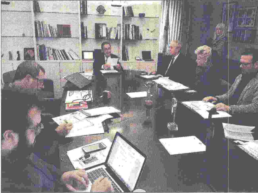
Un momento della conferenza stampa di presentazione del Congresso Inrl tenuta nei giorni scorsi a Brescia dal presidente Baresi

schema contrattuale proiettato già nel futuro professionale dei revisori legali e che sarà modello di riferimento per altri contratti di lavoro in quanto richiama i dettami innovativi della normativa europea.