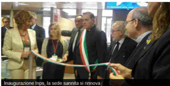
Inaugurazione Inps, la sede sannita si rinnova