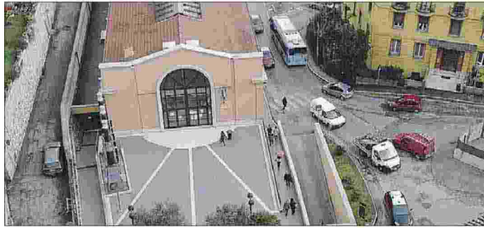
Sequestro preventivo Il tribunale del riesame non ha disposto la revoca della misura adottata con decreto del gip nell'ambito dell'indagine su Um

Le segreterie regionali di Filt-Cgil, Fit-Cisl, Uilt-Uil, Faisa-Cisal , UGL-Autoferrotranvieri e Orsa, subito dopo aver saputo dell'approvazione, da parte della giunta regionale, dello schema di