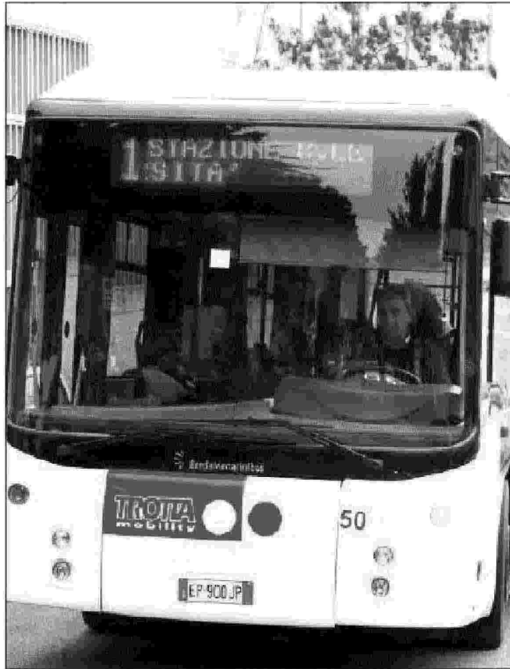
Un autobus di Trota