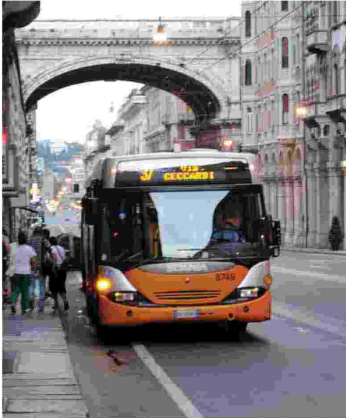
FERMI Gli autobus venerdì a Genova

■ Le organizzazioni sindacali Filt-Cgil, Fit-Cisl, Uiltrasporti, Faisa-Cisal e Ugl Trasporti hanno proclamato uno sciopero regionale di quattro ore per venerdì 27 maggio del personale delle aziende di Trasporto Pubblico Locale della Liguria. Ecco di seguito i dettagli: