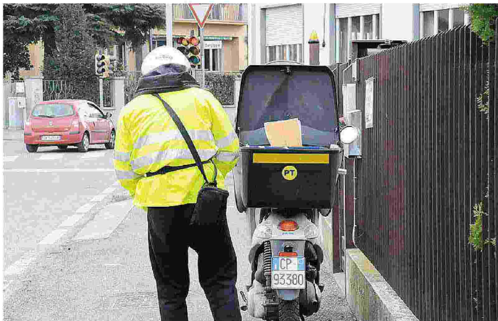
Contro il progetto di recapitare la posta a giorni alterni i sindacati hanno proclamato lo sciopero generale