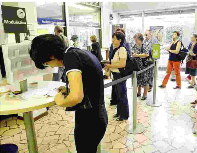
Code alle Poste in un ufficio del Lecchese

«In tutta la provincia di Lecco mancano almeno trenta dipendenti»