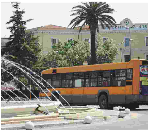
FOGGIA I bus dell'Ataf e la sede della ex municipalizzata