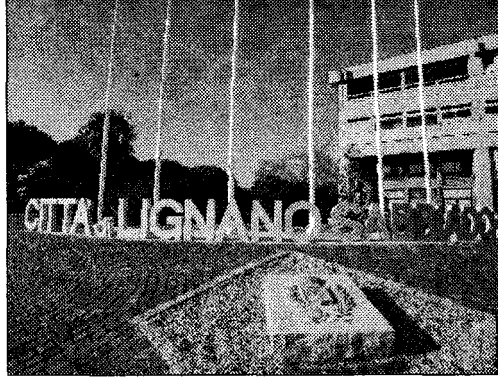
MUNICIPIO La sede del Comune