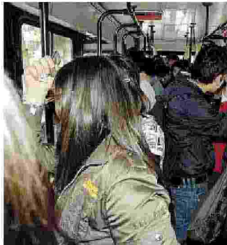
AMTAB La conta dei passeggeri

● Ora l'azienda ordina agli autisti di contare passeggeri in discesa e in salita dai bus urbani. Ma i sindacati insorgono preannunciando mobilitazioni, mentre ai passeggeri non resta che rallentare le proprie capacità motorie per permettere ai conducenti più zelanti di segnare su un apposito foglio di bordo l'affluenza e il deflusso su alcune linee urbane. Scoppia la «guerra del pallottoliere» all'Amtab di Bari.