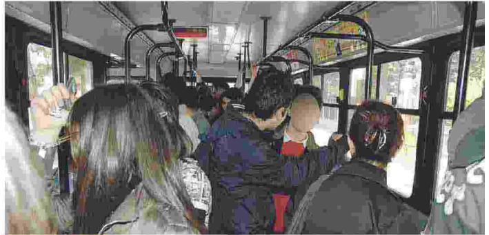
IN UN AUTOBUS AMTAB L'ordine impartito agli autisti è di contare i passeggeri ad ogni fermata