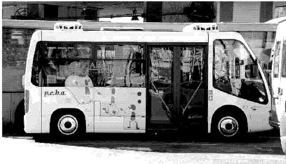
Novità nel trasporto pubblico In alto e a destra i veicoli elettrici acquistati dal Comune di Imperia che saranno utilizzati a Porto Maurizio, in basso i pullman all'idrogeno

Pullman a idrogeno La giunta regionale, su proposta