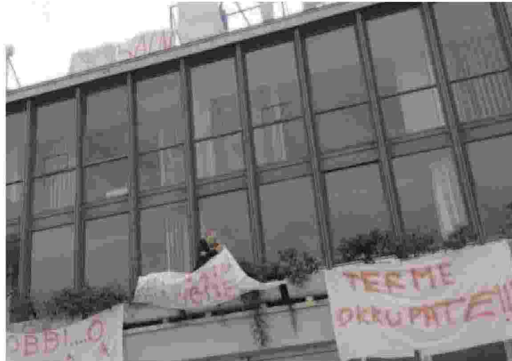
Una protesta dei lavoratori alle Terme, partiti i licenziamenti

Le organizzazioni sindacali pur prendendo atto della posizione fallimentare della Società Terme, hanno ritenuto di non poter sottoscrivere alcun accordo in