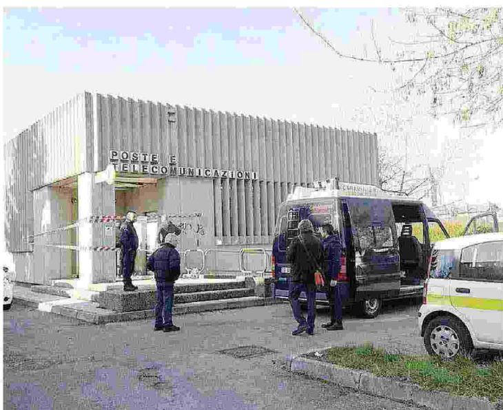
Devastante l'assalto al Postamat compiuto nella notte tra il 10 e l'11 febbraio scorsi