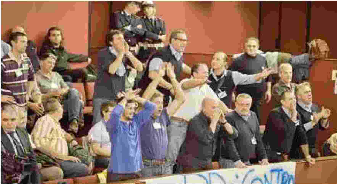
Una protesta in Comune dei dipendenti Amt nel novembre dello scorso anno